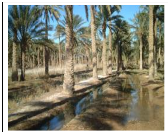
palmeraie irriguée par submersion

L'utilisation des eaux chaudes de l'Albien, notamment dans les régions de Oued Rhir, Oued Souf et Biskra a créé des problèmes de obstruction par entartrage des canalisations destinées pour l'irrigation ou l'AEP et ce, malgré le refroidissement des eaux. Le tartre est constitué des incrustations dures adhérentes aux parois des canalisations formant un aspect cristallin de dépôts.