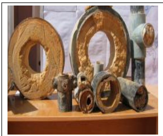
Entartrage de canalisation

L'utilisation des eaux chaudes de l'Albien, notamment dans les régions de Oued Rhir, Oued Souf et Biskra a créé des problèmes de obstruction par entartrage des canalisations destinées pour l'irrigation ou l'AEP et ce, malgré le refroidissement des eaux. Le tartre est constitué des incrustations dures adhérentes aux parois des canalisations formant un aspect cristallin de dépôts.