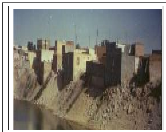
Rejet d'eau usée au centre d'une agglomération