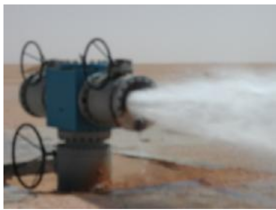
Forage artésien (200l/s)

Les premières conclusions qui se dégagent après plusieurs années d'exploitation des nappes du Continental Intercalaire et du Complexe Terminal du Sahara septentrional sont surtout celles liées aux problèmes de gestion, de planification et de suivi de la ressource en eau. En effet, Il est difficile d'imaginer une gestion rationnelle et durable sans modification du fonctionnement physique, chimique et biologique de l'environnement. Il est difficile également de gérer une ressource sur un territoire aussi vaste sans un modèle mathématique de gestion. Dans ce cadre plusieurs modèles ont été élaborés : ERESS- 1972 et actualisé en 1985 le NEWSAM par et le BRL /CDARS en 1999 avec le concours de l'école des Mêmes de Paris, de l'ANRH et celui du SASS (OSS) avec la collaboration également de l'ANRH en 2002 .L'élaboration de cet outil indispensable, permettra surtout de prévoir à moyen et long terme l'évolution de la nappe en fonction des prélèvements proposés, ainsi que les conséquences de son utilisation.