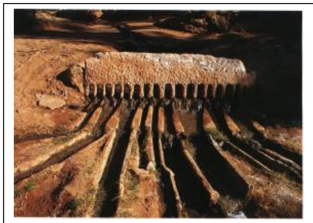
Répartiteur d'eau (Foggara)