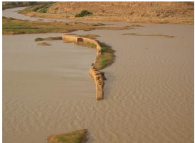
L'oued M'zab en crue et sort de son lit (Ghardaïa)

Les eaux superficielles sont intimement liées à la pluviométrie, notamment dans les bassins versants. Au Sahara, elles sont relativement importantes principalement dans l'atlas Saharien (Chott Melhrir et la région de la Saoura), le M'zab et le Hoggar - Tassili. Ces régions se distinguent par d'importants oueds caractérisés par des écoulements intermittents. Lors des crues, les eaux de ces oueds se perdent généralement dans la nature ou elles se jettent dans les Chotts et ce, par manque d'infrastructures destinées à la mobilisation de ces ressources (barrages, retenues collinaires, )