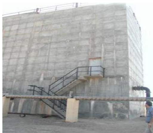
Refroidisseur des eaux chaudes (60°C)