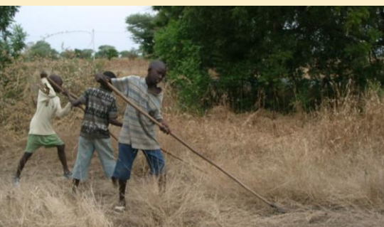
Fauche de foin en bordure de route par des enfants (Sénégal)

La production de foin permet de constituer des réserves pour la fin de la saison sèche, destinées à une partie du troupeau (les vaches laitières par exemple). La récolte de foin permet également de préserver la valeur alimentaire du fourrage, avant qu'elle ne s'abaisse au niveau de celle de la paille en fin de saison sèche. Les foins peuvent être réalisés à partir de fourrages naturels ou cultivés.