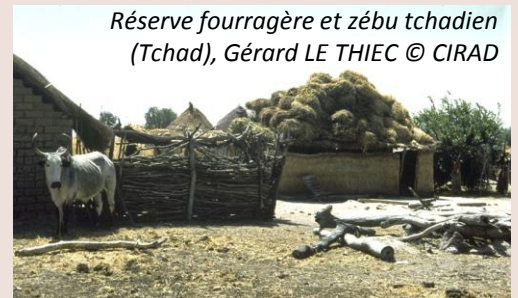
Réserve fourragère et zébu tchadien (Tchad), Gérard LE THIEC © CIRAD