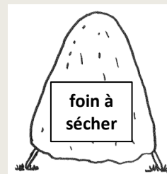
Exemple d'un siccateur