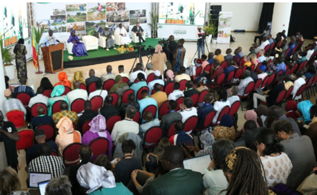
Journées de l'Agroécologie 2023

En 2025, 20 000 tonnes d'engrais organique, 20 000 tonnes d'amendement organique et 100 000 litres d'engrais foliaire organique subventionnés et distribués dans les territoires