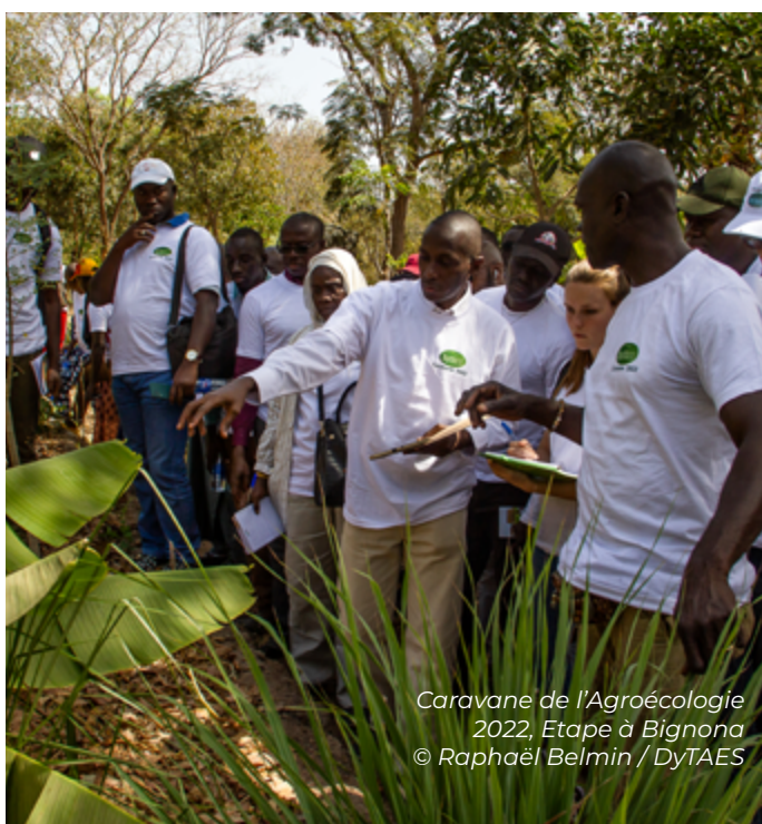
Caravane de l'Agroécologie 2022, Etape à Bignona

La DyTAES se décline dans les territoires avec des DyTAEL qui se mettent progressivement en place. Les DyTAEL sont également informelles et ont une structuration qui peut légèrement varier.